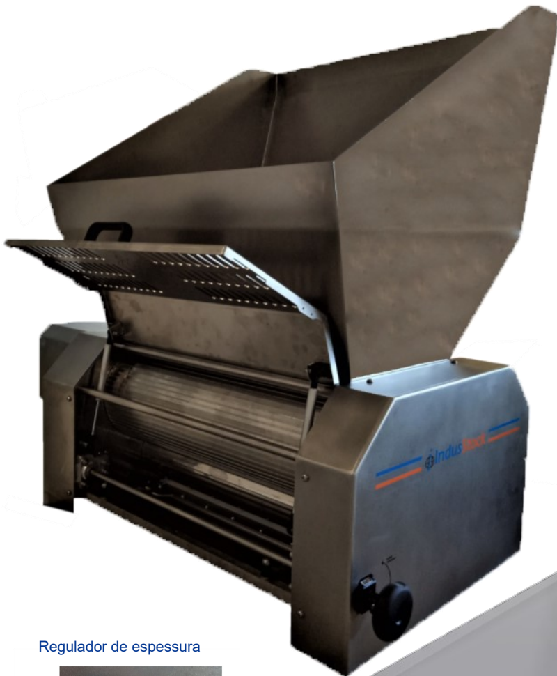
Regulador de espessura